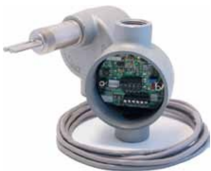
Elettronica montata a distanza per proteggerla dal calore