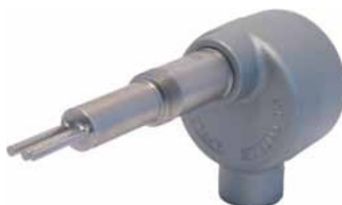
Lunghezza di inserzione a piacere