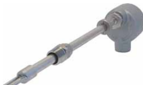
Testa del sensore retrattile (Valvola a sfera di isolamento non mostrata)