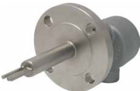
Testa del sensore flangiata